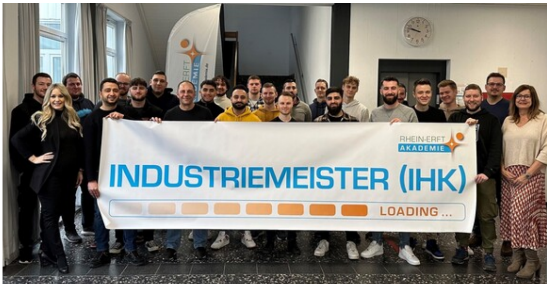
Foto: Kursstart Kompaktkurs für Industriemeister:innen der Fachrichtungen Metall, Elektrotechnik, Mechatronik und Logistik am 04. März 2023.